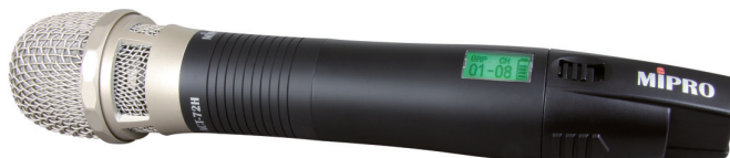
ACT-70H59 / ACT-70HC59