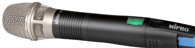
ACT-70H80 / ACT-70HC80